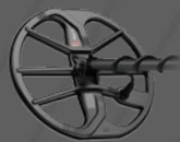
EQX11™ スキッドプレート付きコイル 11" 丸型ダブルDコイル - 最大5 m (16フィート)防水